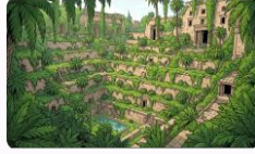
Babil'in Asma Bahçeleri